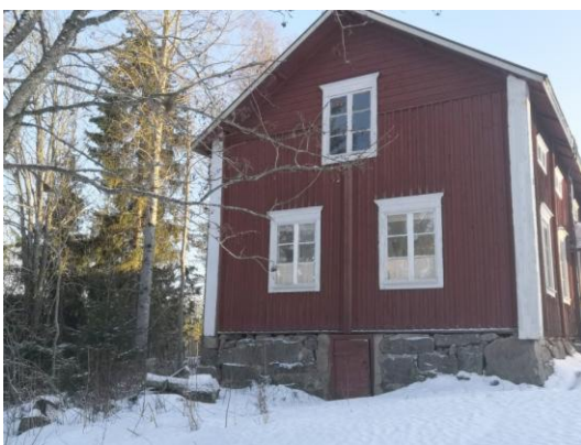
Lehtimäen kansakoulu aloitti toimintansa syksyllä 1891 pappilanmäellä vuokratiloissa.

Kansakoulun paikasta oli sitten riitoja. Toiset vaativat sitä rakennettavaksi Autionmäelle, toiset kirkolle. Autionmäki voitti äänin 558–260. Autionmäellä koulu olisi keskellä Lehtimäkeä, jolloin kenenkään koulumatkasta ei tulisi liian pitkä ja koulu "ei myöskään häiritsisi kirkon pyhyttä". Taimelan kansakoulu alkoi sitten toimintansa syksyllä 1891, ensin tilapäisesti pappilanmäen renkituvan päähän rakennetussa uudessa rippikouluhuoneustossa, kunnes uusi oma koulurakennus valmistui käyttökuntoon syyslukukauden 1893 alkuun nykyiseen Keskikylään, josta alkoi koulun myötä kehittyä pitäjän keskusta.