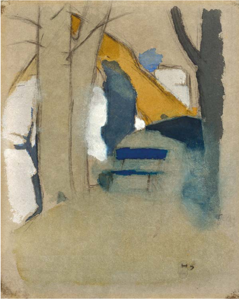
Helene Schjerfbeck Varjo muurilla noin 1928 31 × 25 cm akvarelli- ja guassiväri paperille