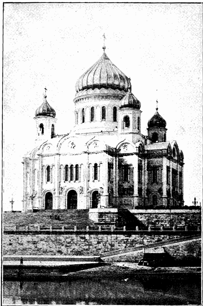
Vapahtajan tuomiokirkko Moskovassa.