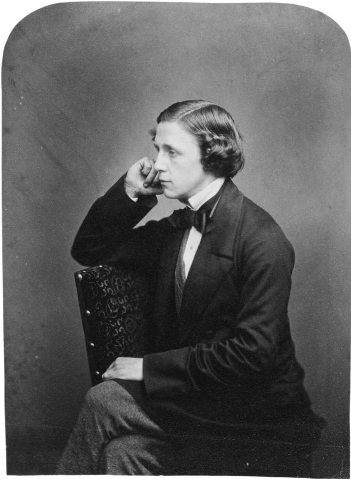
L. Dodgson [alias "Lewis Carroll"]