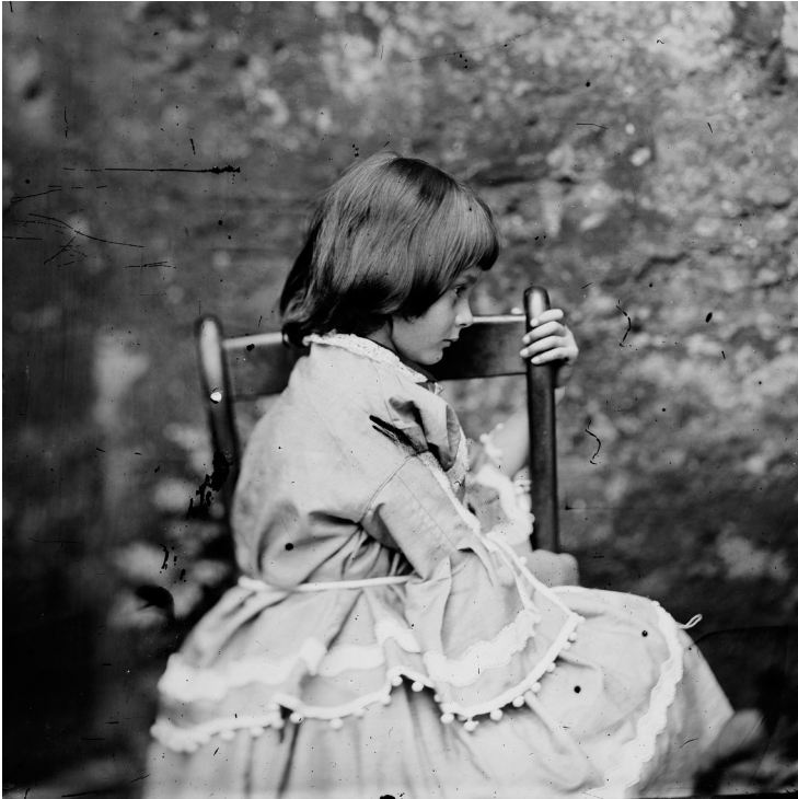
Alice Liddell vuonna 1859. Valokuva Charles L. Dodgson. Negatiivi kuuluu National Portrait Galleryn kokoelmiin.